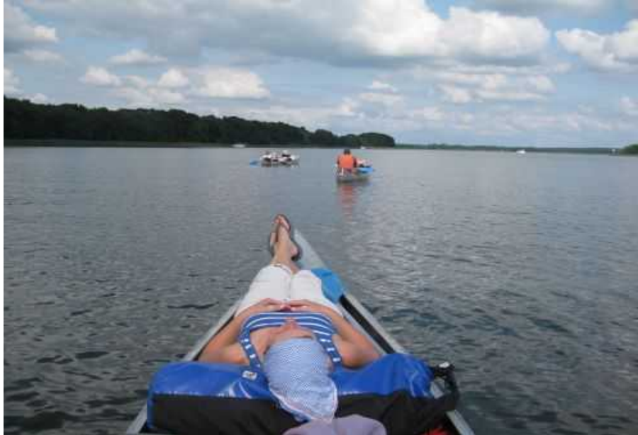
Urlaub mit sehr hohem Chillfaktor – Kanutour auf der Mecklenburger Seenplatte

In unserem, von immer mehr Menschen als hektisch empfundenen Leben, zieht ein Weniger an Geschwindigkeit in vielen Fällen ein Mehr an (Er)Lebensqualität nach sich. Unsere „langsamen“ Aktivitäten leisten einen wichtigen Beitrag zur Entschleunigung. Entspannung und Erholung sind in aller Regel die erhofften Konsequenzen.