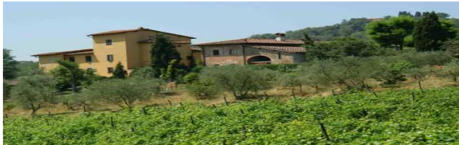
Unser kleines Paradies liegt in der Toskana – ökologisches Weingut und stilvolles Landhaus in einem. Hier erwarten uns nicht nur die kulinarischen Genüsse aus dem eigenen Garten, sondern auch manch edler Tropfen aus dem eigenen Weinberg.