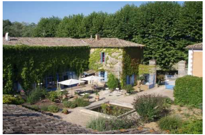
Das Mas des Oules: früher Weingut, heute Künstleratelier. Diese Oase der Ruhe mit südfranzösischem Flair ist Mittelpunkt des Natours Klassikers „Auf den Spuren der Römer die Provence entdecken“.