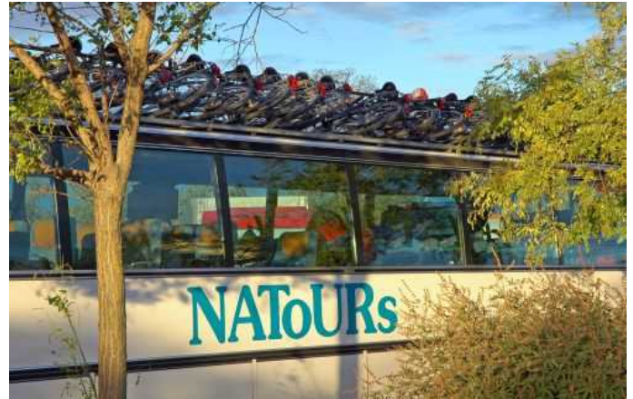
Auf dem Weg in den Süden – der Bike & Bus Provence (DOR)

Viele unserer Reisegäste können sich nach der Radreise gar nicht vom Natours-Mietrad trennen. Kein Problem, denn alle unsere Räder sind zu fairen Preisen zu erwerben (Foto: Modellbeispiel).