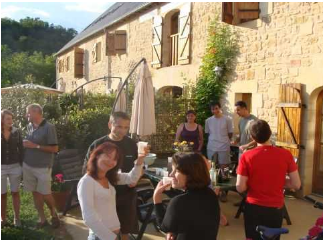
Willkommen im Dordognetal – ein liebevoll umgebautes Farmhaus ist Ausgangspunkt unterschiedlichster Ausflüge in einem der schönsten Flusstäler ganz Frankreichs.